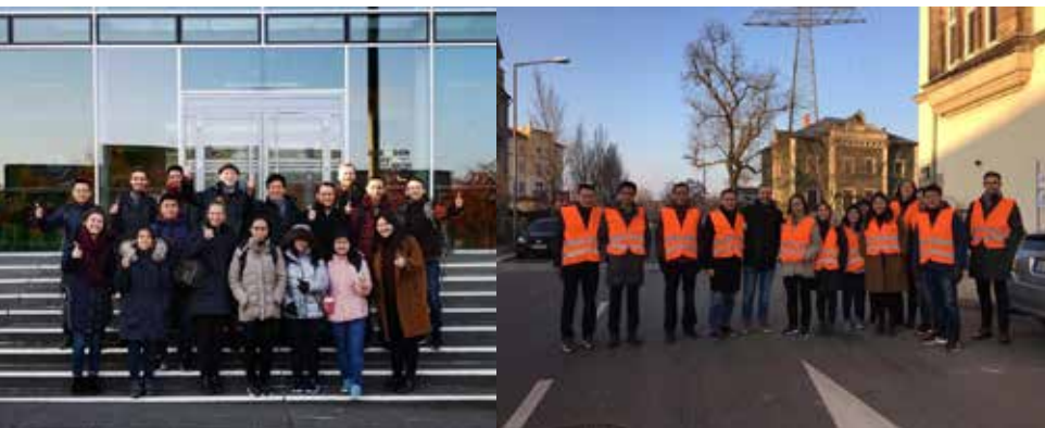
Tham quan nhà máy phân loại chất thải nhựa ở Dresden