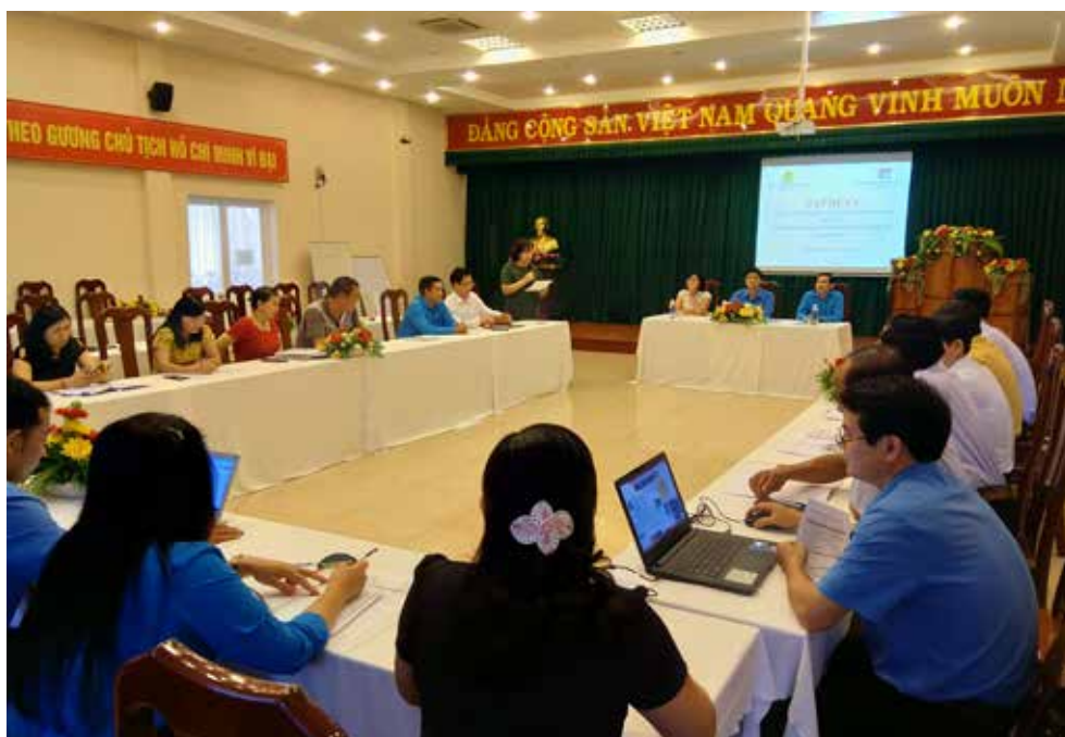
Tương tác trên lớp giữa giảng viên và học viên

Lớp đào tạo 4 ngày giới thiệu và hướng dẫn cho cán bộ công đoàn về 2 tài liệu này tổ chức vào tháng 4/2019, tại Đồng Tháp với sự tham gia của các nhóm cán bộ công đoàn từ Liên đoàn lao động 9 tỉnh mục tiêu gồm: Nam Định, Ninh Bình, Thừa Thiên Huế, Quảng Nam, Bình Định, Long An, Tiền Giang, Đồng Tháp và Bà Rịa - Vũng Tàu. VNCPC và SCPRC đã biên soạn nội dung đào tạo lồng ghép nhiều ví dụ thực tiễn và trình chiếu video clip minh họa, thực hiện đào tạo trên lớp, kết hợp tham quan thực tế nhằm giúp cho các cán bộ công đoàn hiểu rõ những kiến thức TTX trong sổ tay đào tạo để có thể triển khai hướng dẫn TTX trực tiếp tại các doanh nghiệp trong thời gian tới.