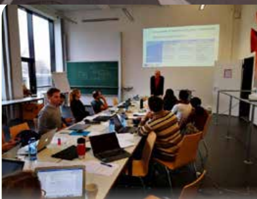
Nhóm cán bộ dự án tham gia khóa đào tạo giảng viên tại Đại học Công nghệ Dresden