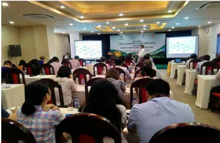
Các lớp tập huấn cung cấp nhiều kiến thức hữu ích cho học viên

Nội dung tập huấn bao gồm: giới thiệu khái niệm, các bài học kinh nghiệm liên quan đến CSCN; trình bày công cụ và phương pháp chính để phát hiện cơ hội CSCN và huy động các bên liên quan; trường hợp điển hình về CSCN ở Việt Nam và một số quốc gia khác như Thụy Sĩ, Hàn Quốc, Tuy-ni-di.