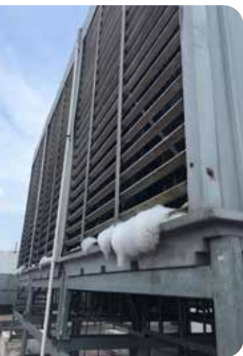
Dàn ngưng nhiều bọt do ít bảo dưỡng