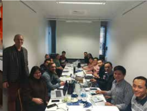
Cuộc họp giữa các đối tác của dự án