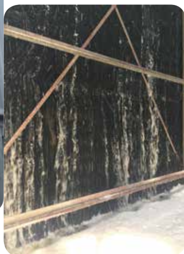
Nước làm mát phân bố không đều trên tấm tản nhiệt dàn ngưng