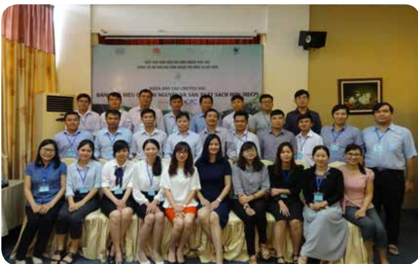
Các học viên tham gia đào tạo tại Tp. Hồ Chí Minh