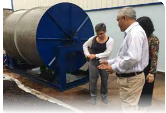
Đơn vị phát triển công nghệ giải thích quy trình sản xuất than sinh học từ công nghệ nhiệt phân

Dự án đã đánh giá nhu cầu của thị trường than sinh học sản xuất từ hệ thống nhiệt phân quy mô nhỏ sử dụng nhiên liệu sinh khối ở Việt Nam. Hệ thống nhiệt phân kết hợp Flox (PPV300) được phát triển dựa trên thiết kế của Oekozentrum (Thụy Sĩ) và được Công ty Cơ khí Viết Hiện sản xuất. Toàn bộ quá trình chuyển giao công nghệ do UNIDO hỗ trợ.