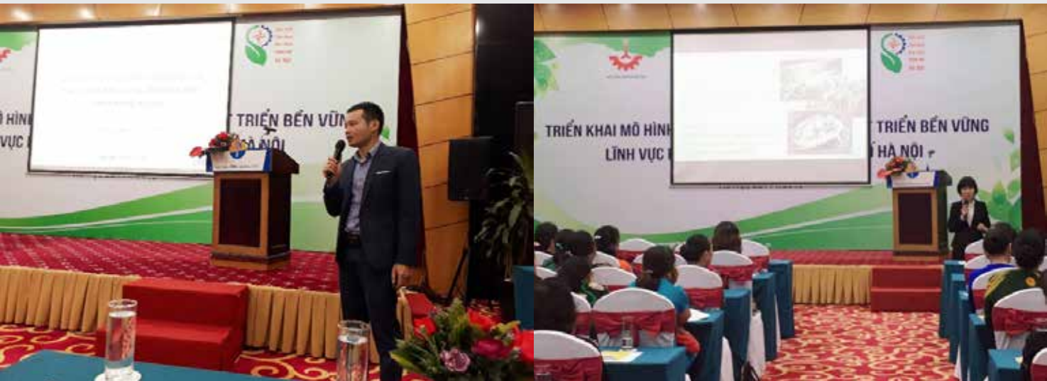
Chia sẻ kinh nghiệm về xây dựng mô hình sản xuất và tiêu dùng bền vững

Hoạt động của VNCPD là một trong những nỗ lực góp phần thúc đẩy sản xuất và tiêu dùng bền vững, giảm rác thải nhựa, bảo vệ môi trường - vấn đề không chỉ của riêng các quốc gia mà còn mang tính toàn cầu.