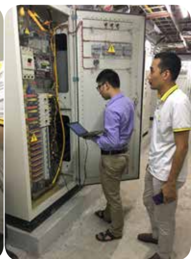
Đo đạc các thông số của hệ thống điện tại TTTM Vincom Phạm Ngọc Thạch