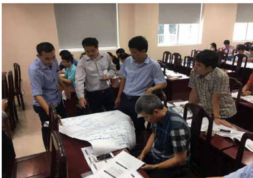
Thảo luận nhóm tại khóa tập huấn cơ bản

Khóa tập huấn cơ bản được tổ chức vào cuối tháng 8/2019, tại Hà Nội nhằm giúp các học viên nắm được phương pháp thực hiện SXSH, có khả năng hướng dẫn và phổ biến thực hiện SXSH tại các doanh nghiệp. 40 học viên đã tham dự tập huấn trong 3 ngày. Giảng viên của VNCP đã giới thiệu và hướng dẫn các nội dung về SXSH bao gồm: định nghĩa, lợi ích, trường hợp nghiên cứu điển hình và phương pháp triển khai, trong đó lý thuyết được đan xen với bài tập thực hành, ví dụ minh họa và trình chiếu video clip về thực tiễn tại doanh nghiệp.