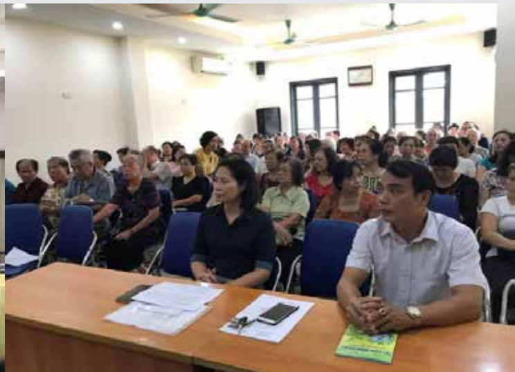
Chia sẻ kinh nghiệm về giảm sử dụng túi ni lông và đồ nhựa dùng 1 lần