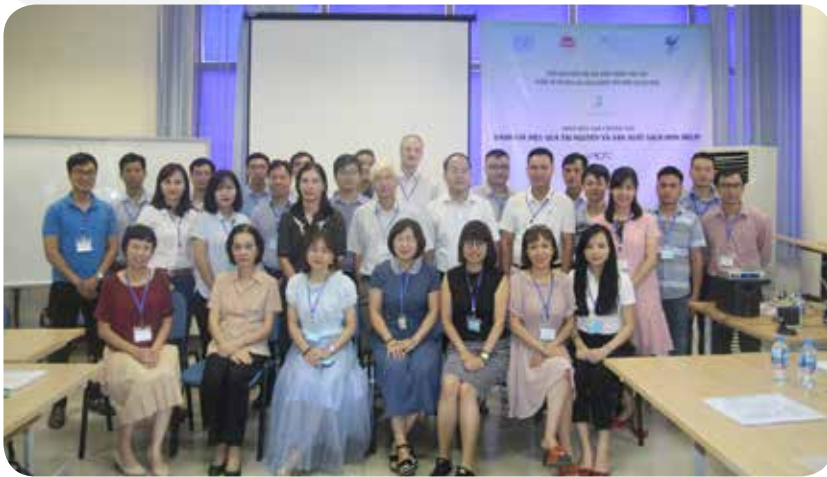
Các học viên tham gia đào tạo tại Hà Nội

Khóa đào tạo đã diễn ra tại 2 thành phố lớn là Hà Nội và thành phố Hồ Chí Minh với sự tham gia của 54 học viên trên cả nước. Sau khóa đào tạo các học viên tham gia đã nhận được chứng chỉ của dự án.